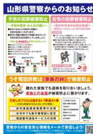
【共同制作のクーポン付きチラシ 表面・裏面】